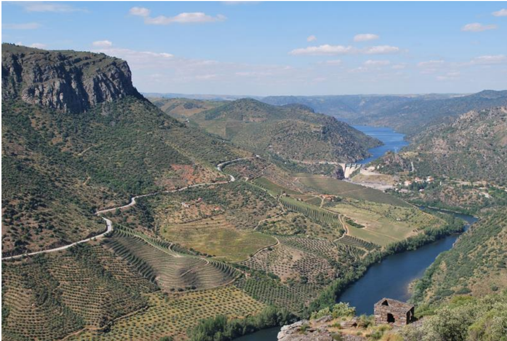
Rio Duero (Douro)

Vanaf parkeerplaats terug naar brug lopen en even voor brug RA omhoog via landweg richting Penã la Vela (3,3 km). Na ruim 300 m komt landweg van links (punt C op de kaart). Vanaf hier route beschrijving volgen.